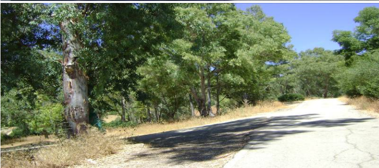
Meta Tramo A Salida Tramo B