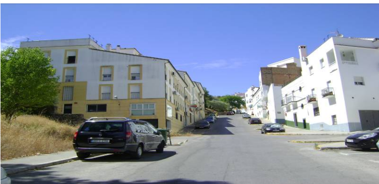
Salida Tramo A Meta Tramo B