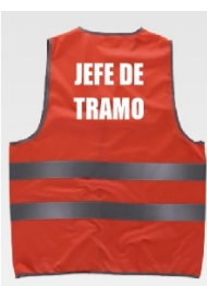
JEFES DE TRAMO